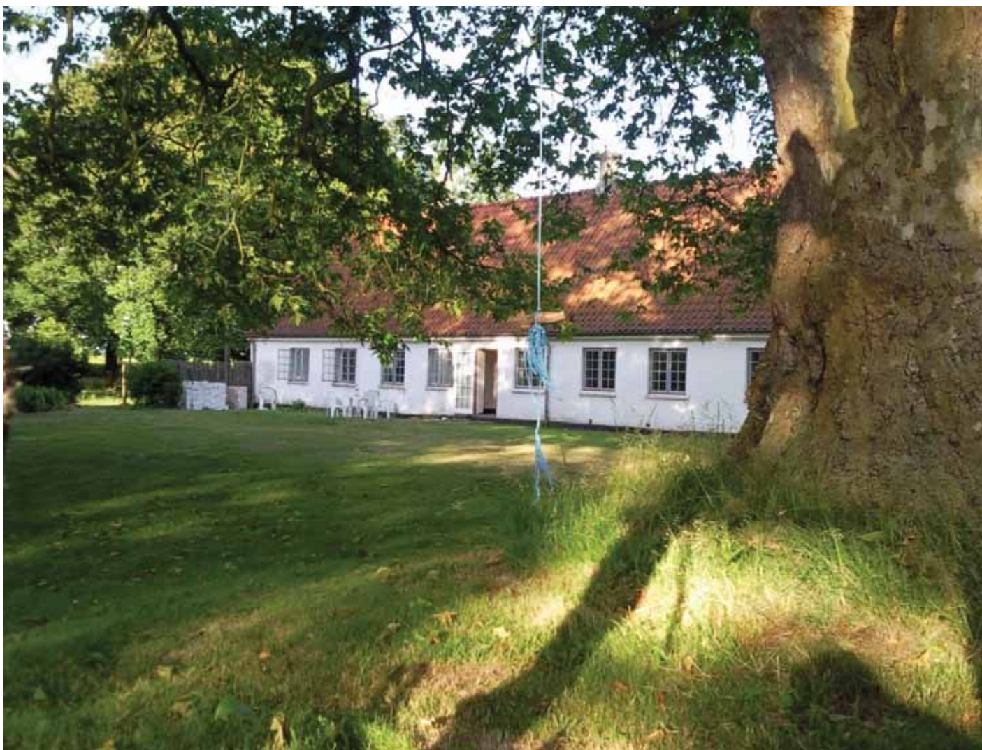
Den 135 år gamle gård under Wedellsborg Gods har ifølge OBH Ingeniørservice skimmelsvamp. Nu er den lejet ud til en højere husleje.

behandling. Det sidste begrundes af advokaten med, at analysen fra OBH-gruppen dokumenterer en sandsynlig fugtskade i ejendommen. Endvidere at kommunen ikke har foretaget en teknisk undersøgelse af ejendommens bygningsmæssige forhold, sådan som den skal i henhold til byfornyelsesloven. Og at lejemålets badeværelse i stuetagen har givet et væsentligt fugtproblem, som hverken er undersøgt af kommunen eller af et teknikerfirma.