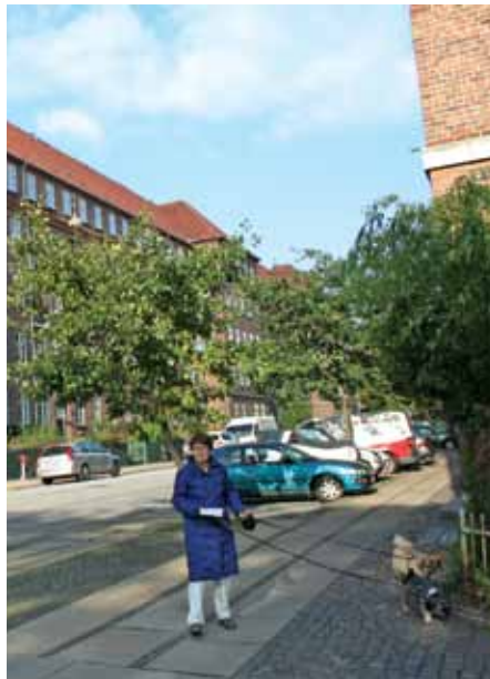
890.000 danskere bor i almene boliger. Staten støtter opførelsen og drift af disse boliger med et økonomisk tilskud på ca. 1 mia. kr. årligt - såkaldt tilskud til murstenene. Herudover har vi i Danmark individuelle tilskud til huslejen i form af boligydelse og boligsikring. Endvidere den såkaldte reguleringsgevinst.

EU-Kommissionen når formentlig i sin indstilling frem til, at hvert enkelt medlemsland kan indrette støtten som man ønsker, så længe det har en social begrundelse. I Danmark vil det indebære, at man kan fortsætte som hidtil. Argumentet er, at såfremt støtten kun skulle gives til de svageste, ville de almene boligområder kun måtte udlejes til lavindkomster. Hermed ville de almene boliger blive beboermæssigt ensrettet. Det ville føre til flere udsatte boligområder, og det vil ødelægge den såkaldte sammenhængskraft, som er nødvendig for at demokratiet kan overleve.