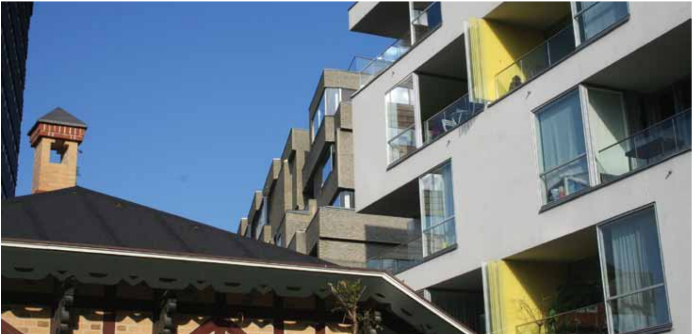
Tilgangen af boliger til udlejningssektoren består af meget dyre boliger og af store boliger, som unge og singler ikke har råd til at betale.

Vi har mistet 54.000 betalelige små private udlejningsboliger. Disse boliger var en vigtig del af boligforsyningen til unge og enlige. Til sammenligning er der i 10 års-perioden 2002 – 2012 kun blevet fuldført og påbegyndt 10.600 ungdomsboliger. Tilgangen af boliger i øvrigt til udlejningssektoren består af meget dyre boliger og af store boliger, som unge og singler ikke har råd til at betale.