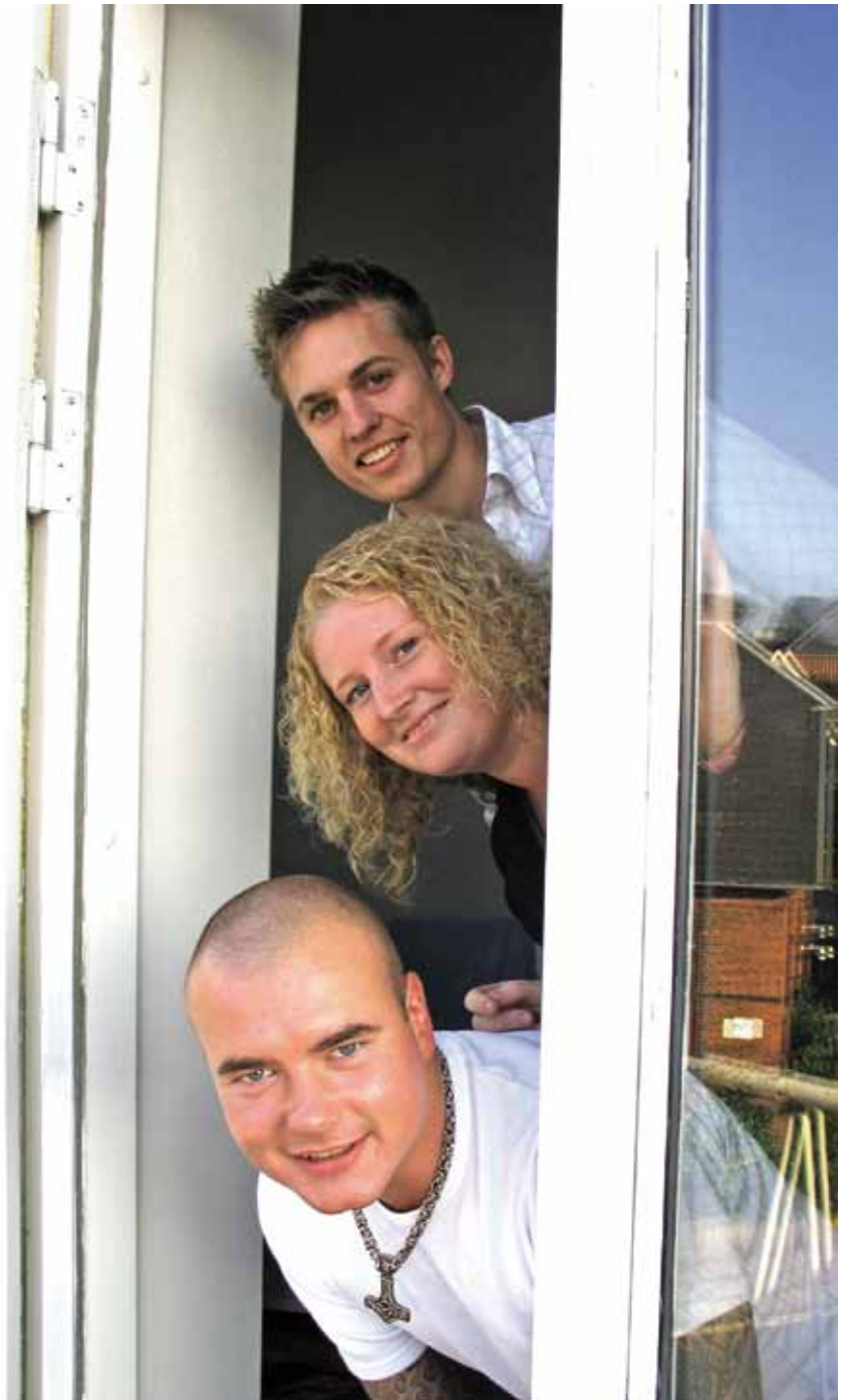
Hvis to eller tre lejere skriver sig på lejekontrakten og den ene ønsker at flytte, kan udlejer vælge, at den fraflyttende bliver på lejekontrakten, fordi han så stadig hæfter overfor udlejer.

Et særligt problem er det, at mange unge tror, at de kan overtage en lejlighed ved at flytte ind hos en bekendt og derefter blive boende med kammeraten i to år, indtil han så flytter ud. Denne regel gælder kun for kærester, og man skal kunne bevise, at man både har et økonomisk, socialt og "seksuelt" samliv.