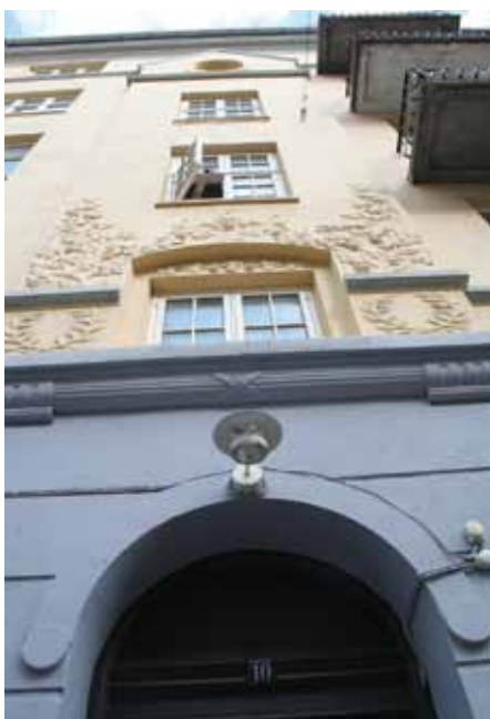
Det var i denne ejendom på Nørrebro i København, at universitetet tog en alt for høj husleje af sine studerende.

Universitetet har på alle måder stukket piben ind. Det svarede aldrig på en henvendelse fra Lejernes LO i Hovedstaden om i fremtiden at tage kontakt til de almene boligorganisationer, når universitetet skal anviser gode og billige boliger til udenlandske studerende. Universitetet har også opgivet at anke den tabte sag i Huslejenævnet.